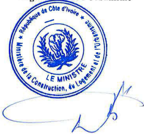
Bruno Nabagné KONE

Le Ministre de la Construction, du Logement et de l'Urbanisme